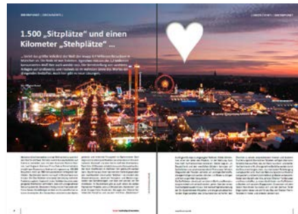
forum Nachhaltig Wirtschaften (Print)

Hier finden Sie unsere Mediadaten für das Print-Magazin.